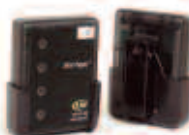
Localizador de Servicio Recargable