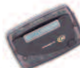
Alfanuméricos 1-Línea Recargable