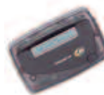
Alfanumericos 1-Linea Recargable