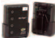
Localizador de Servicio Recargable